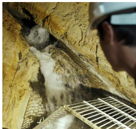
Die Stindl-Jörg-Quelle ist eine der Haupttrinkwasserquellen für den Großraum Köflach

Damit jederzeit ausreichend Trinkwasser zur Verfügung steht, betreiben wir ein rund 185 Kilometer langes Leitungsnetz,