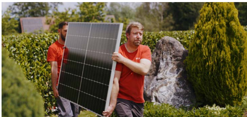
Moderne Technik im Einsatz – für mehr Komfort, Sicherheit und Energieeffizienz im Alltag.

Die Abteilung Haustechnik der Stadtwerke Köflach steht Ihnen mit umfassender Kompetenz zur Seite – für ein Zuhause, das sicher, komfortabel und bestens für die Zukunft gerüstet ist. Wir freuen uns darauf, Ihre Projekte umzusetzen.