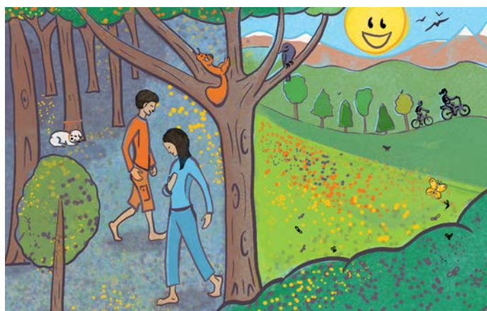
Ein morgendlicher Barfuß-Spaziergang im Wald tut wohl und entspannt – und das trotz der 5 Fehler, die sich im zweiten Bild eingeschlichen haben. Findest du sie?