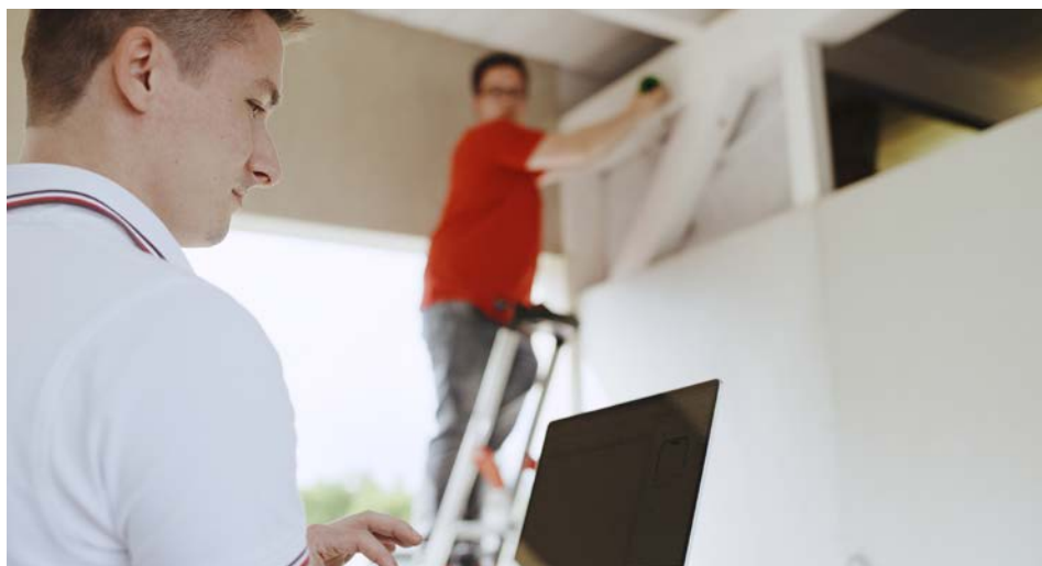
Schnelle Hilfe direkt vor Ort – damit nicht nur Ihre IT sicher und zuverlässig funktioniert.