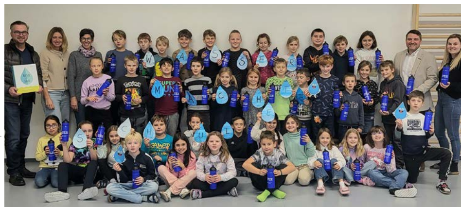
Mit Fridolin auf Entdeckungsreise – wir vermitteln schon den Jüngsten den bewussten Umgang mit Wasser.

Montag bis Donnerstag: 7:00–15:30 Uhr Freitag: 7:00–13:00 Uhr