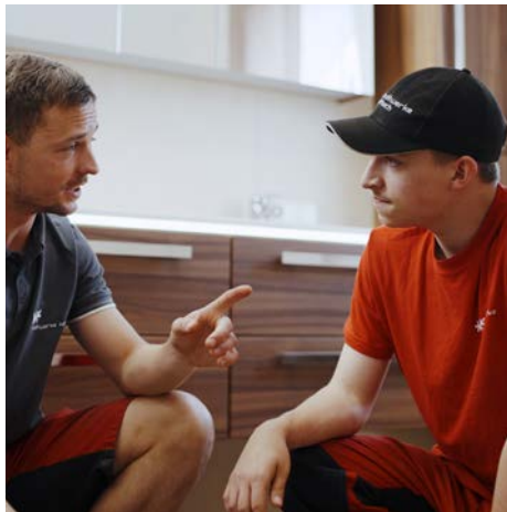
Schritt für Schritt zum Facharbeiter – mit Unterstützung und Verantwortung.

PRAXIS, VERANTWORTUNG UND ECHE UNTERSTÜTZUNG: UNSERE LEHRLINGE GESTALTEN DIE ZUKUNFT DER ENERGIE- UND TECHNIKBRANCHE AKTIV MIT.